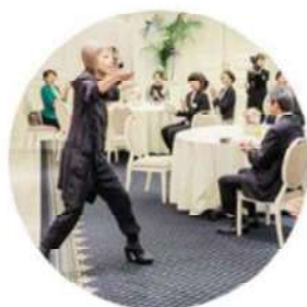
社内カレッジの開校支援