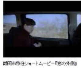
静岡県移住ショートムービー『恋の外傳』