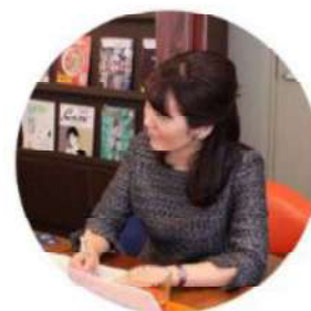
アドバイザーのご契約